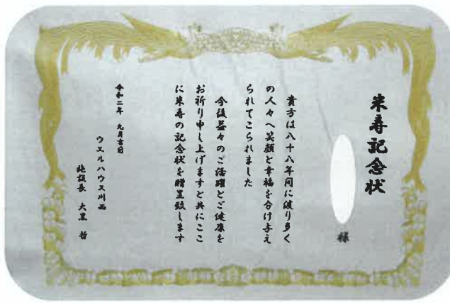
【対象の方全員にお渡ししました】