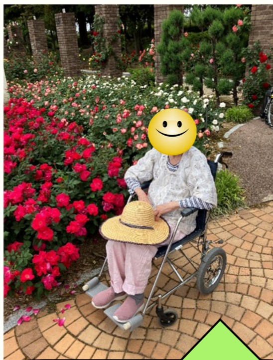
利用者様も大満足のご様子でした

また、外の空気を感じながら歩いたり景色を見たりすることで、心身ともにリフレッシュできました。これからも季節を感じられる行事や外出を通して、皆様に楽しい時間を過ごして頂けるよう取り組んでまいります。