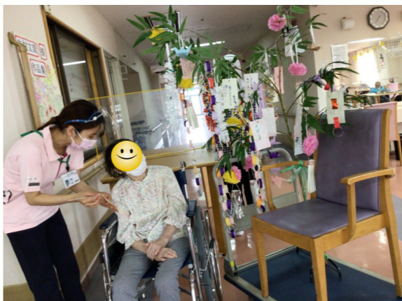
皆で星に祈ります