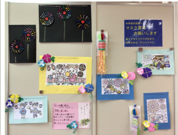
花火と祭りのイラスト

最寄駅 阪急「川西能勢口」 から徒歩約10分 JR「川西池田」 から徒歩約15分