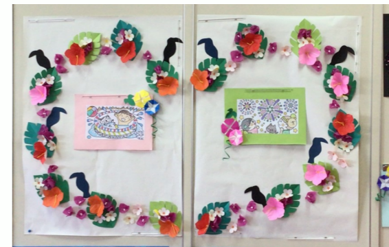
花で作ったハートと壁一面の花火