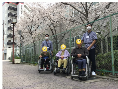
異なる桜もきれいです