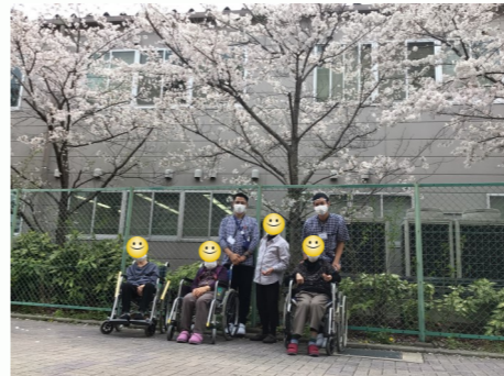
桜の前でみんなで撮影

来月は遠足も予定しているので利用者様が喜んでくださる様、職員も色々な イベントを考えていきたいと思えました。