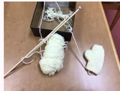
手編みで服を作りました！