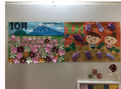
10月のイラストと木に集う鳥たち