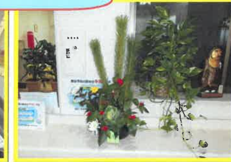
【1月のお花は「門松」風に】