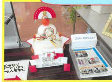
【お正月といえば鏡餅！】