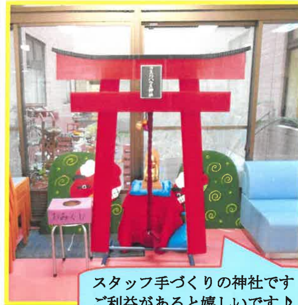
スタッフ手づくりの神社です ご利益があると嬉しいです♪

月に一度の生け花では、残念ながら教えてくれる先生が今はいませんが、皆様思い思いに活かしておられます。また、お正月にお参りをする雰囲気味わえるよう、スタッフが段ボールなどを使い『ウエルハウス神社』の鳥居を作りました。ぜひお参りしてってください。