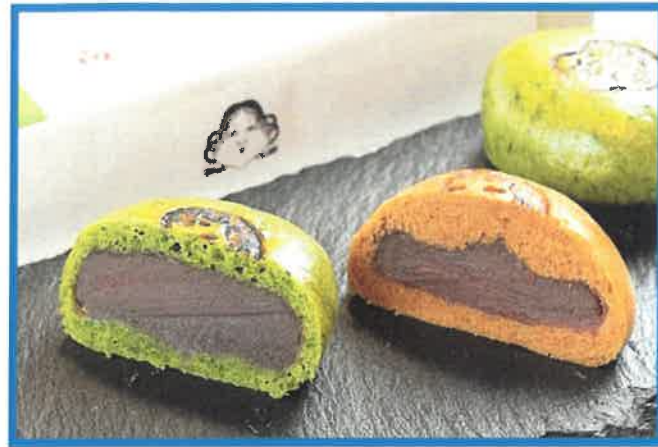
三重県 伊勢内宮前 岩戸屋 より