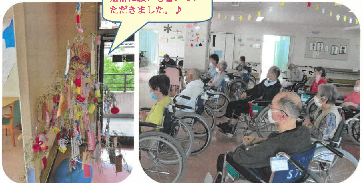
短冊に願いも書いていただきました。♪

7月の行事会は各フロアにてDVD鑑賞を行いました。笑点やドリフのコントなどを見ていただきました。 「大きなスクリーンで見れて楽しかった。」「普段見られないものがたくさん見れた。」と、いつもより大きめの画面で見られることを喜んでくださった方も多かったです。 今回は体を動かす行事会ではありませんでしたが、ゆったりと鑑賞できる機会を思い思いに楽しまれていた様子です。