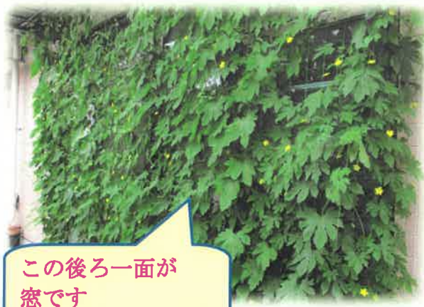
この後ろ一面が窓です

通所リハビリの窓の外には。現在ゴーヤが生い茂っています。綺麗な花の時期を経て、少し控えめなゴーヤが生り始めています。 また花や実だけでなく葉っぱ全体が広く窓を覆っている為、真夏の太陽の熱を少し遮断してくれるところも助かっています。