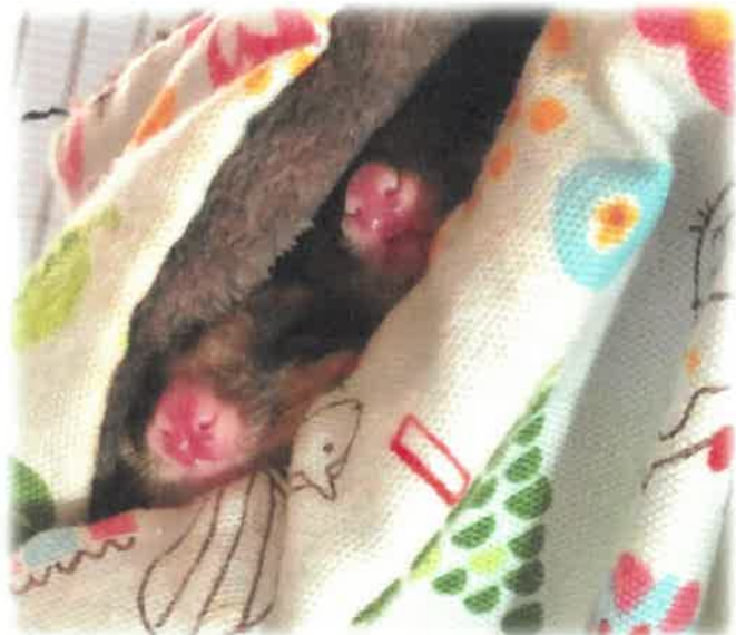
【見つめるまん丸な瞳がたまらないです！！】【おやつの匂いに鼻のひくひくが止まらない】