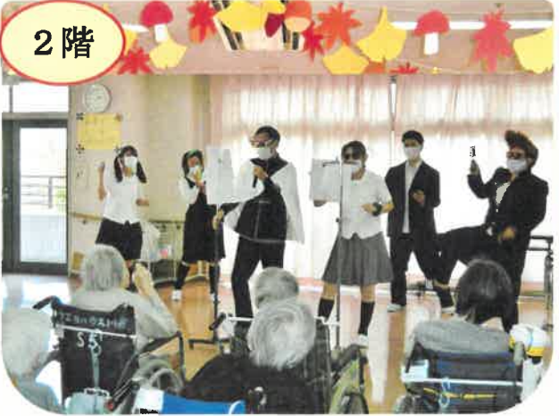
2階では有志職員で結成された仮装グループによる歌で盛り上がりました。学生の制服でいつもと違う姿でしたが大いに楽しんでもらえた様子です。