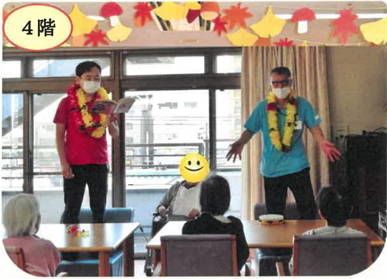
4階では、利用者様一緒になって歌を歌いました。懐かしの音楽だと、とてもイキイキと歌ってくださいます。

11月11日の行事『文化祭』では、各フロアにて職員による出し物を行いました。どのフロアでも、いつもと違う衣装に身を包み、それぞれの一芸やネタを披露しました。 ちよつと恥ずかしい気持ちもありましたが、利用者様が楽しく盛り上がり、嬉しく思いました。