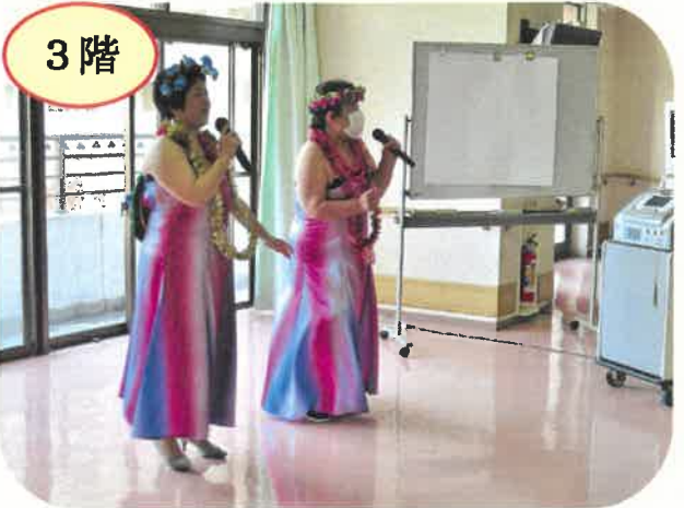
3階では、紅白対抗別歌合戦です。利用者の5名の方々に審査員をして頂き、職員に1人1曲好きな歌を歌って頂き競い合いました。結果は引き分けでしたが、それだけ甲乙つけがたかったということでしょうか。