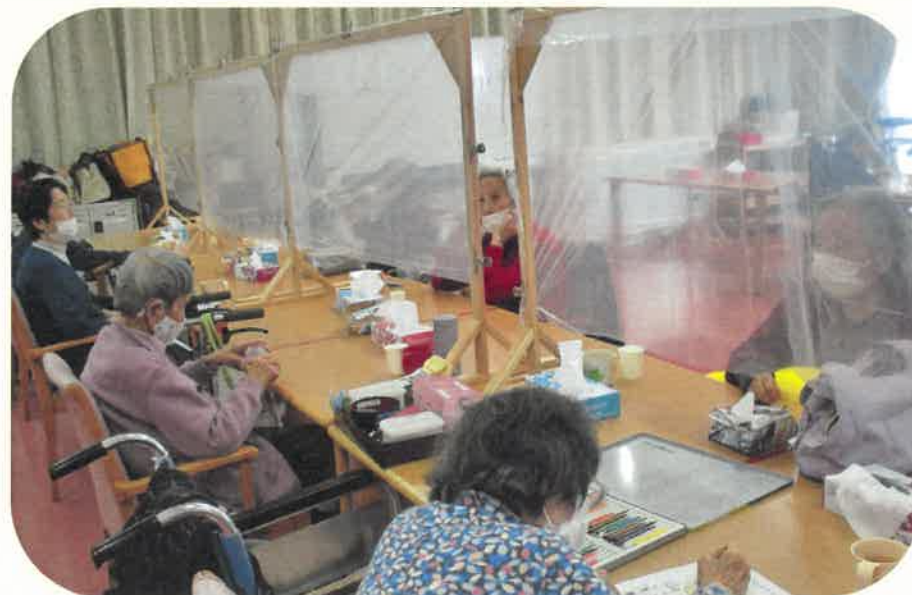
【通所でも例えば、透明のついたてを立てるなど、沢山対策しています】

新型コロナウイルスのことはとても心配ですが、利用者様やご家族様の日々の生活も大事なことです。「いつもの生活」と「ウイルスへの対策」、バランスを大切にしていきたいと思います。