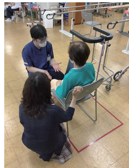
ご家族とのお話し場面