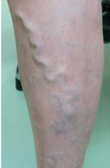
直径5mm程度に発達した静脈瘤