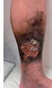
下肢静脈瘤が進行して潰瘍を形成