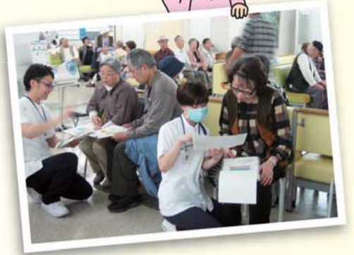
〈5月9日(木)病院1階フロア〉