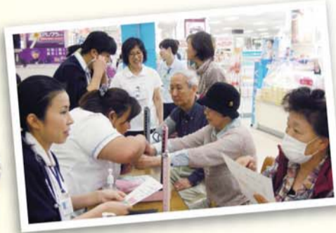
〈5月10日(金)イズミヤ千里丘店〉